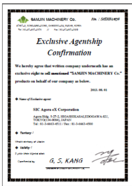
«サンジンマシーナリー正規総代理店»

経済性・耐久性を追求した ハンマーグラブです。 スプリングを使用せず、オープン 設計なので現場でのメンテナ ンスも簡単にできます。